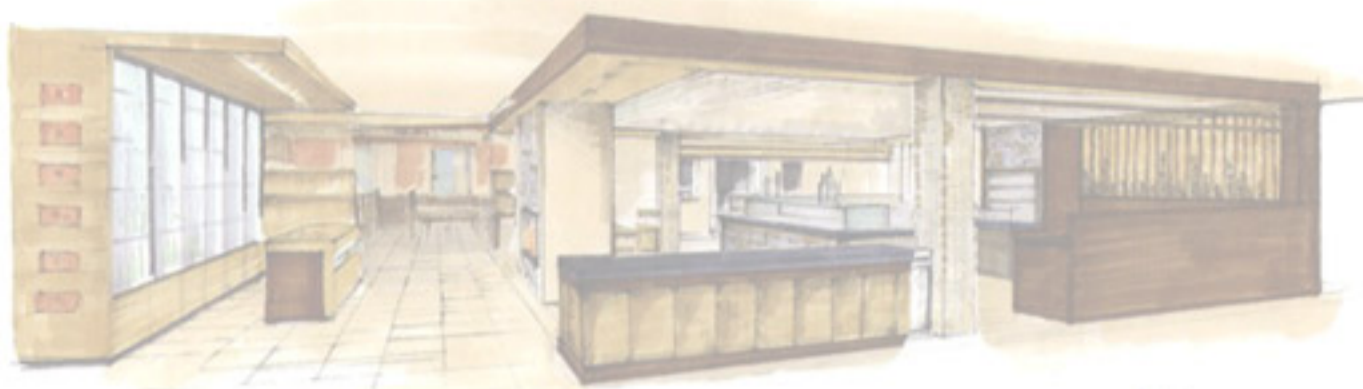
Rendering vom Buffet des „Andreas“ in Südtirol ab seite 14