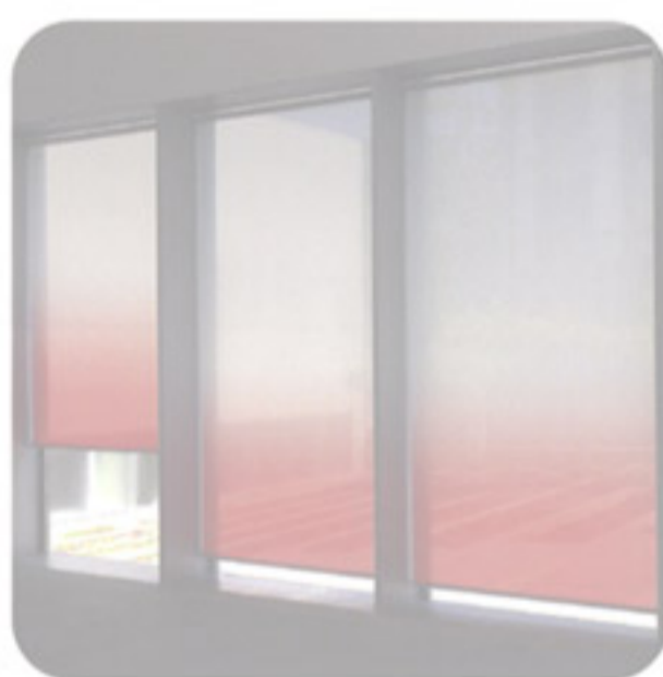
Rollos – Bilder am Fenster seite 40