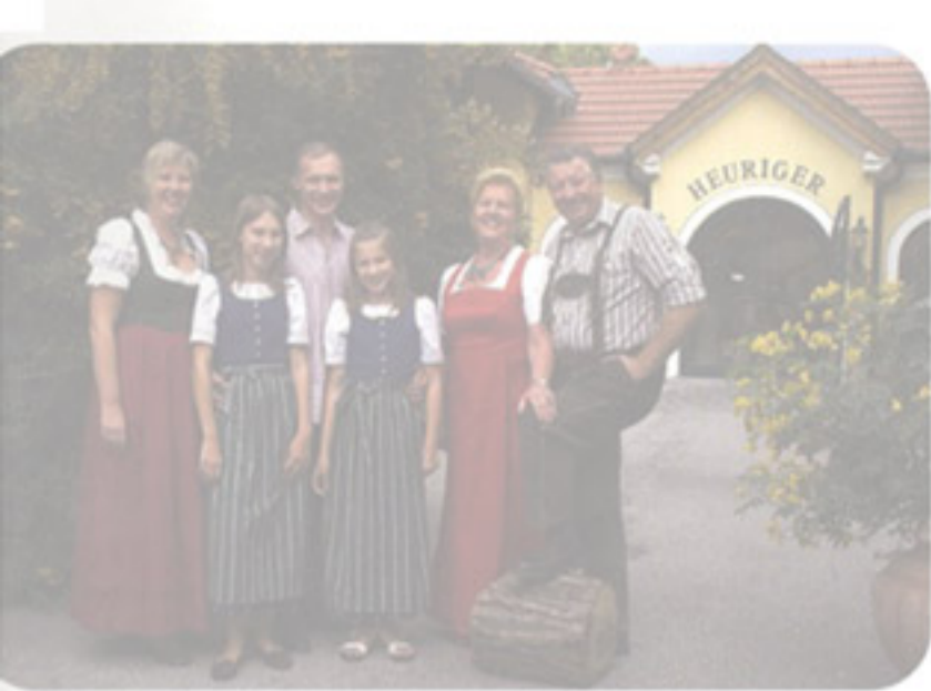
Heuriger „Dreimäderlhaus“ – Familie Taschler-Toyfl seite 45