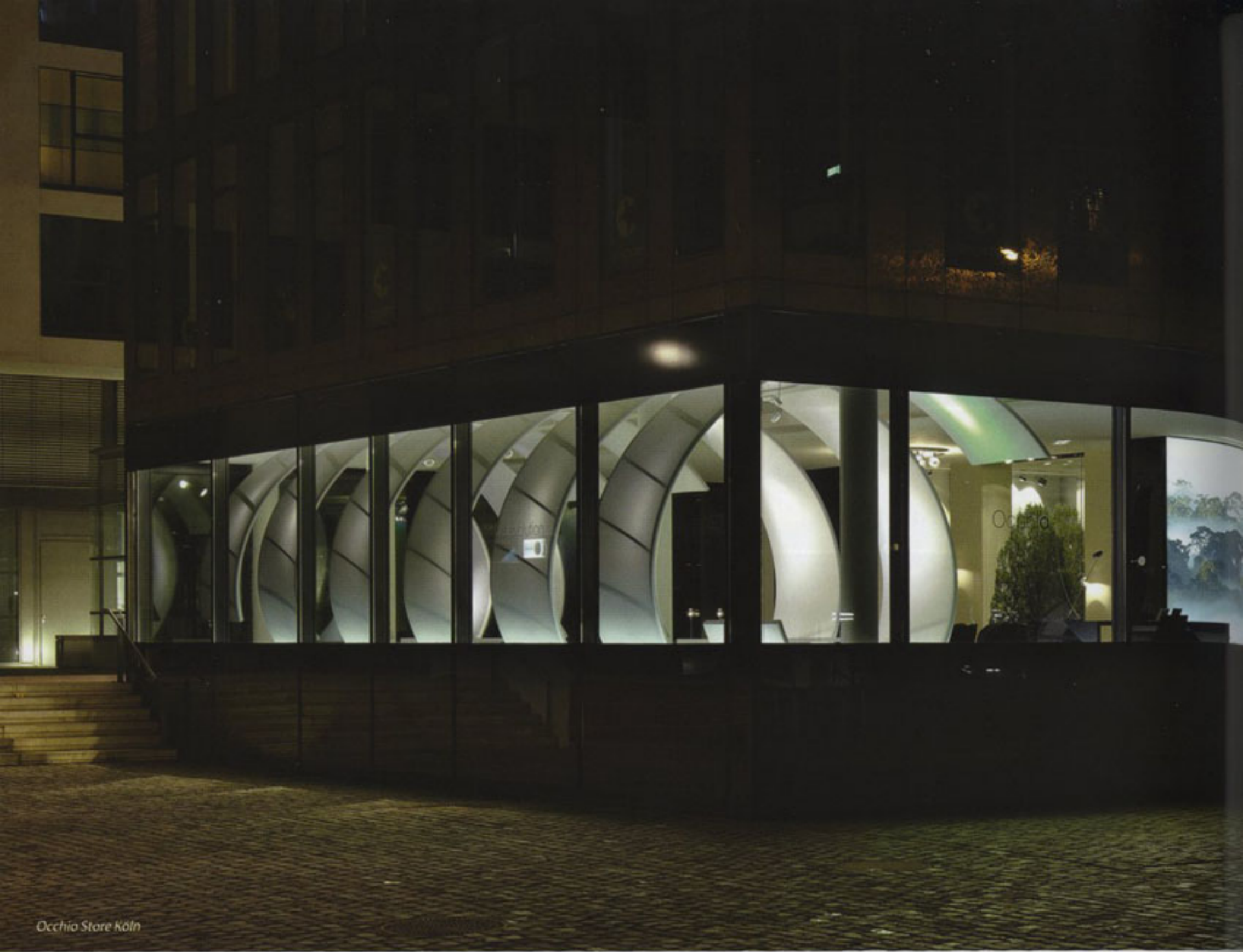
Occhio Store Köln