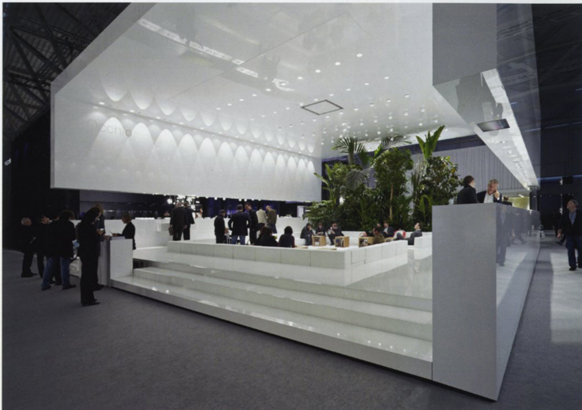
Unter dem Motto „one source – one system – Lichtqualität in allen Lebensbereichen“ präsentierte Axelveiselicht während der Weltleitmesse „light + building“ 2010 in Frankfurt am Main die multifunktionale Strahlerserie Occhio Più und begeisterte mit seinem spektakulären Auftritt 180.000 Messebesucher.

Axelmeiselicht zählt zu den wachstumsstärksten Unternehmen in der Lichtbranche und ist in Deutschland, in der Schweiz und in Österreich Marktführer im Bereich hochwertiger Designleuchten. Occhio gilt als eines der erfolgreichsten Lichtprodukte der letzten Jahre, dessen hochinnovatives Kopf-Körper-Prinzip aus folgender Überlegung resultiert: „Wie platziere ich eine Lichtquelle im Raum genau da, wo sie benötigt wird – und wie schaffe ich damit die optimale Lichtwirkung für die jeweilige Situation?“ Occhio ist das Ergebnis einer 25-jährigen Beschäftigung mit Licht und zugleich nur der Anfang eines kontinuierlichen Innovationsprozesses, denn: light is evolution.