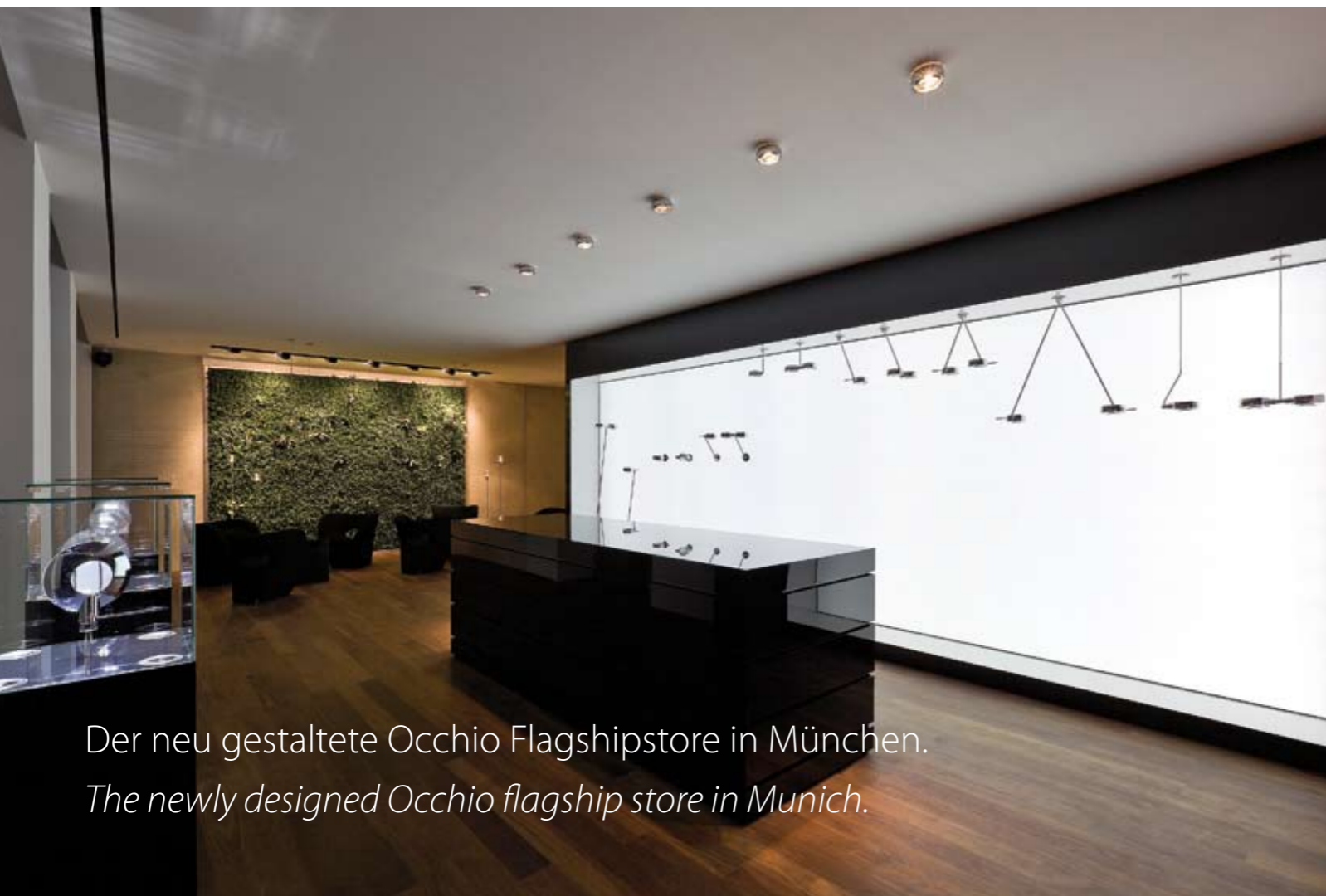
Der neu gestaltete Occhio Flagshipstore in München. The newly designed Occhio flagship store in Munich.

On 400 m 2 the newly designed Occhio flagship store in Munich combines all facets of the Occhio brand world in an exciting mix of architecture, lighting design and product experience. The multifunctional flagship concept of the store, a joint project of Axelmeiselicht, Martin et Karczinski and Drändle 70|30, combines a store, showroom